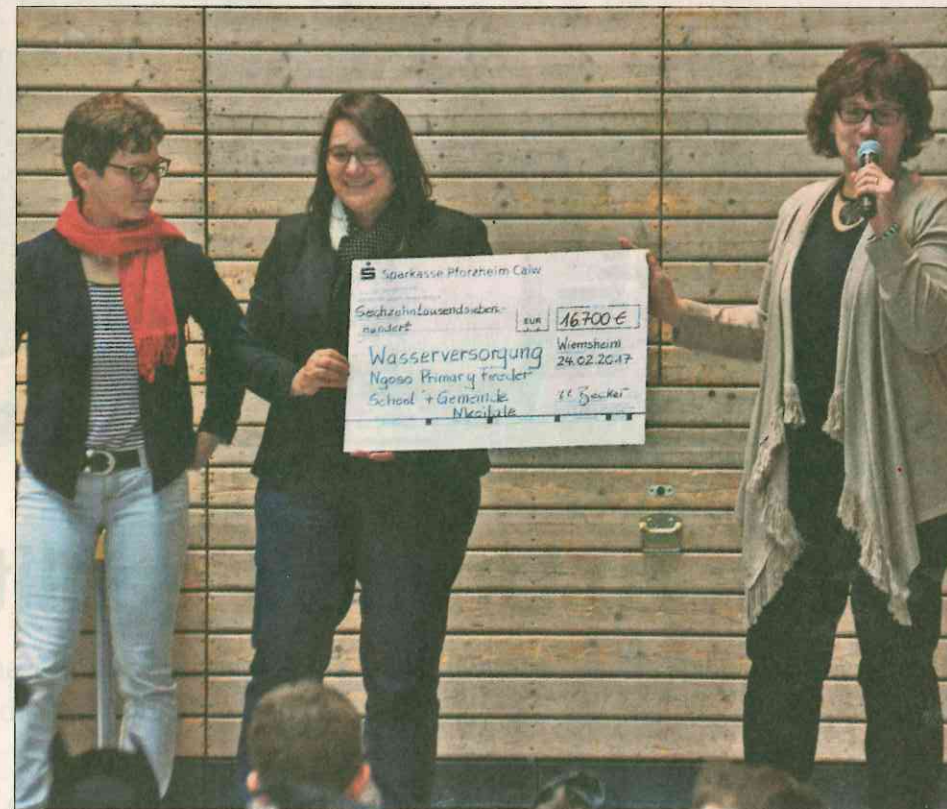
Mit der großzügigen Spende der Schüler soll in der Masai Mara in Kenia Trinkwasser für eine Ortschaft gesichert werden.

In trockenen Zeiten kommt es für Menschen und Vieh immer wieder zu Zwischenfällen mit wilden Tieren, wie Elefanten und Büffeln, die oft mit Verletzungen oder sogar tödlich enden können. In